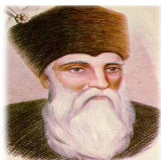
Școala Gimnazială "Miron Costin" Bacău